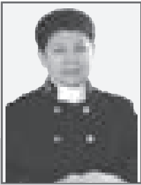
Жанара ТЛЕУБАЕВА, Судья Специализированного межрайонного суда по уголовным делам Костанайской области

Основными задачами уголовного права является защита прав, свобод и законных интересов человека, собственности, общественного порядка и безопасности от опасных преступных посягательств и предупреждения новых уголовных правонарушений.