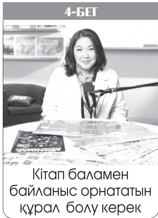
4-БЕТ Кітап баламен байланыс орнататын құрал болу керек