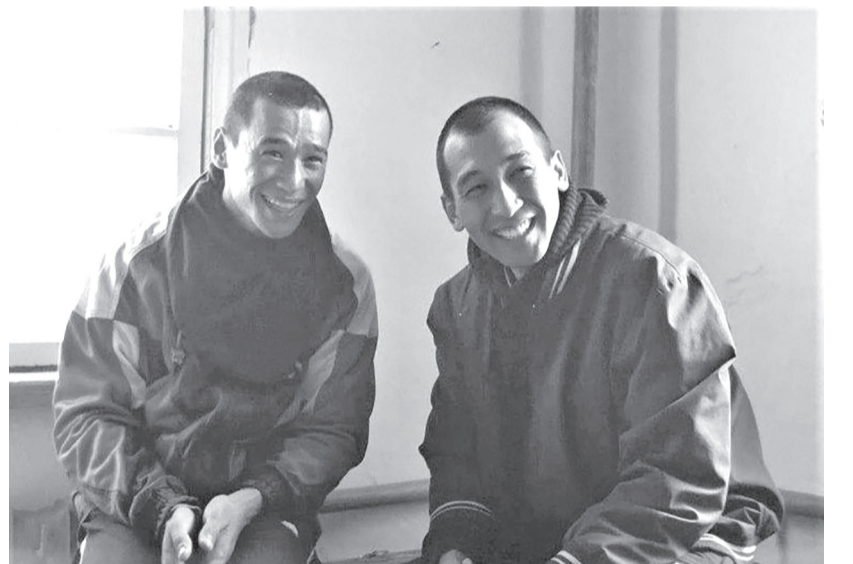
Государственного центра поддержки национального кино. Съемки картины прошли в Алматы и Алматинской области. В национальный

Фильм снят кинокомпанией Golden map media при содействии