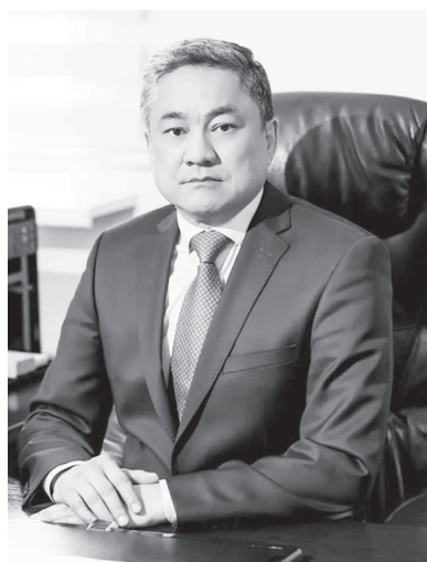
Мұрат ӘУБЕКІРОВ, Маңғыстау облыстық сотының судьясы

Сот билігі – еліміздегі басқа билік салаларынан дара, өз қызметінде тәуелсіз әрі кесімді шешім айтатын ерекше орган. Міне, сондай ерекше органның бірі де бірегейі бола білген Маңғыстау облыстық соты жарты ғасырдан бері үздіксіз қызмет етіп келеді. Сот төрелігін жүргізуде ең бірінші сот шешімдерінің жеделдігін арттырып, сот істерінің созбалаңға салынуына жол бермей, халықтың сотқа қолжетімділігі мен ашықтығын қамтамасыз етіп келе жатқан облыстық сот биыл 50 жылдығын тойлауда.