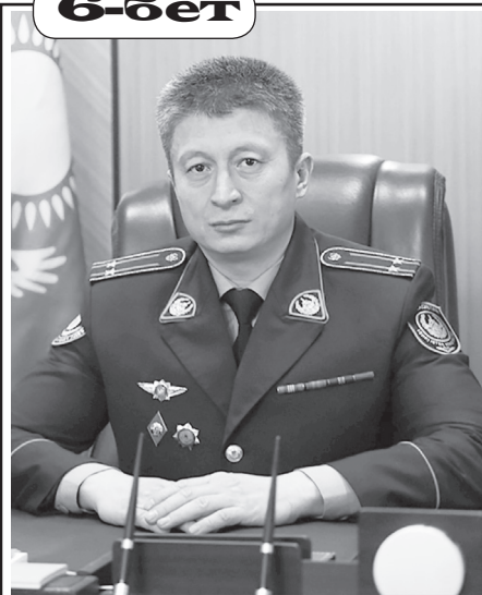
Сапарғали ЖҰМАҒҰЛОВ, Шымкент қаласы және Түркістан облысы бойынша Қылмыстық-атқару жүйесі департаментінің бастығы: «Цифрлық бақылау түрмелердегі қауіпсіздікті күшейтеді»