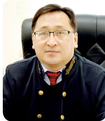
Серик ШАХАМАНОВ, судья Специализированного следственного суда г. Костаная

В своем Послании народу Казахстана от 16.03.2022 года «Новый Казахстан: путь обновления и модернизации» Глава государства К-Ж. Токаев указал, что «Конституция имеет высшую юридическую силу и является основой всей правовой системы страны».