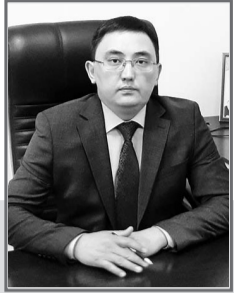
Нуржан ОМАРОВ, председатель Специализированного суда по административным правонарушениям г. Павлодара

Глава нашего государства особое внимание уделяет защите гражданских прав, механизм обеспечения которых претворяется, в частности, путем функционирования независимого и беспристрастного судебного органа.