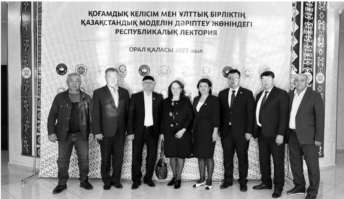
ҚОҒАМДЫҚ КЕЛІСІМ МЕН ҰЛТТЫҚ БІРЛІКТІҢ ҚАЗАҚСТАНДЫҚ МОДЕЛІН ДӘРІПТЕУ ЖӨНІНДЕГІ РЕСПУБЛИКАЛЫҚ ЛЕКТОРИЯ

Орал қаласының Достық үйінде Қазақстан халқы Ассамблеясының қолдауымен «Қоғамдық келісім мен жалпыұлттық бірліктің қазақстандық моделін дәріптеу» тақырыбында республикалық дәріс өтті. Дәріс аясында дөңгелек үстелдер, презентациялар өткізілді.