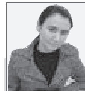
Материалы 4-й и 5-й полос подготовлены сборком «ЮГ» по Западно-Казахстанской области Саïдой ТУЛГЕНОВОЙ

Как и в первом случае, этот человек также был осужден к 11-летнему сроку отбытия наказания в исправительном учреждении максимальной безопасности.