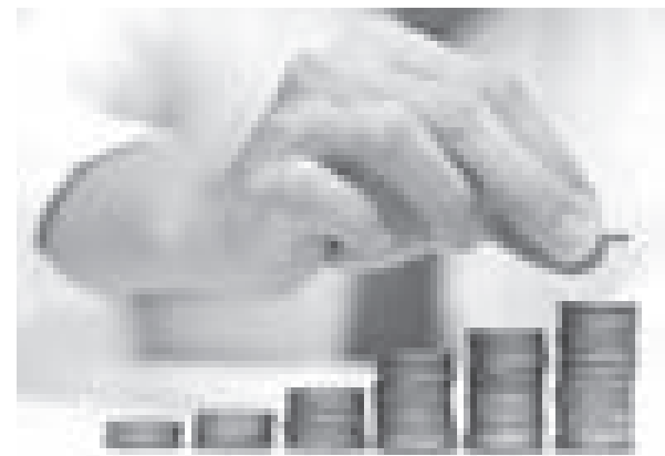
БАҒА ЫРЫҚҚА КӨНБЕЙ БАРАДЫ