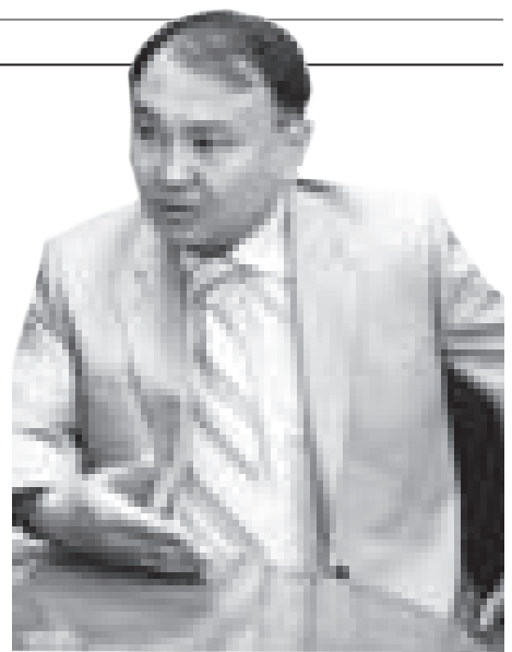
сындағы жолайрық, ара жігін ашып алу фундаменті.

Партияларды тіркеу жеңілдейді. Партияны тіркеу үшін бар-жоғы 5 мың адамның қолы қажет. Бұл партиялық құрылыс жылдамдап, жаңа саяси күштер пайда болады деген сөз. Парламенттің Мәжілісіне және жергілікті маслихаттарға тікелей сайлау, мөжаритарлық жүйе енеді. Бұл аспект Парламент пен маслихаттардың халыққа есеп беру дәрежесін арттырады. Бұл өзгерістердің барлығы ертең халық мүддесі тұрғысынан жасалған жаңа заңдардың пайда болуына алып келеді. Өткендегі олигополия, әділетсіз экономикалық жүйе, жеке бір топтың саяси монополиясы келмесе кетеді деген сөз. Бұл Конституция жобасының ең басты ерекшелігі саяси монополияны келмесе кетіреді, экономикалық игіліктерді халыққа қайтаруға алғышарт жасайды. Жаңа Конституцияның жобасы өткен мен болашақтың, ескі саяси жүйе мен жаңа әділетті, саяси плюрализмге бағытталған жүйе ара-