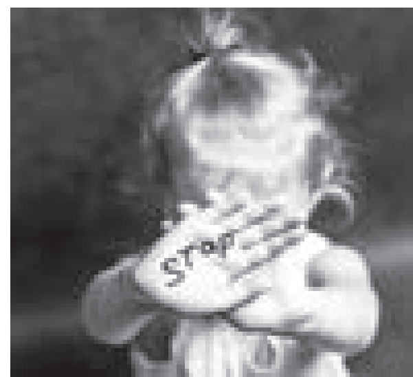
БАЛА ҚҰҚЫҒЫ БАСТЫ НАЗАРДА