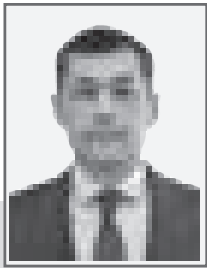
Нурлан АУБАКИРОВ, судья Специализированного межрайонного административного суда г. Нур-Султана

Полная реализация публичных прав, свобод и интересов физических и юридических лиц, укрепление законности в публично-правовой сфере являются одними из главных задач административных процедур. Каждый вправе в установленном порядке обратиться в административный орган, к должностному лицу или в суд за защитой нарушенных или оспариваемых прав, свобод или законных интересов.