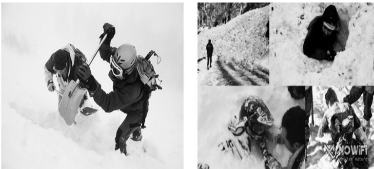
М. УСЕРБАЕВ, ҚР ТЖМ «Қазселденқорғау» ММ «Оңтүстік аумақтық пайдалану-техникалық басқармасы» филиалы Шымкент өндірістік-пайдалану бөлімшесінің басшысы