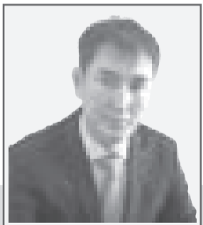
Ерлан НУРШАРЫПОВ, судья Мартукхского районного суда Актюбинской области

Указанное наглядно проявляется в содержании ст. 16 Кодекса, в которой сказано, что административное судопроизводство осуществляется на основе активной роли суда. Суд, не ограничиваясь объяснениями, заявлениями, ходатайствами участников административного процесса, представленными ими доводами, доказательствами и иными материалами административного дела, всесторонне, полно и объективно исследует все фактические обстоятельства, имеющие значение для правильного разрешения административного дела. Судья вправе высказать свое предварительное правовое мнение по правовым обоснованиям, относящимся к фактическим и юридическим сторонам административного дела. Суд по собственной инициативе или мотивированному ходатайству участников административного процесса собирает