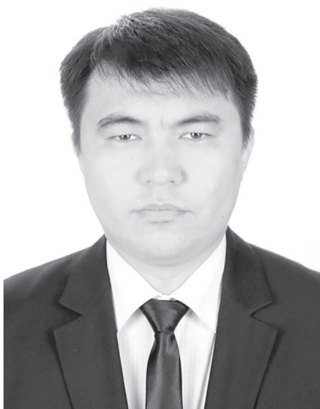
Erjan ҚАЛКЕН, Май аудандық сотының төрағасы

- қажет болған жағдайда – мемлекеттік баж төлеуді кейінге қалдыру, оны бөліп төлеу, төлеуден босату туралы; сот сараптамасын тағайындау туралы; дәлелдемелерді талап ету туралы; куәларды шақыру туралы; талап қоюды қамтамасыз ету туралы жазбаша өтінішхат және басқа да өтінішхаттар.