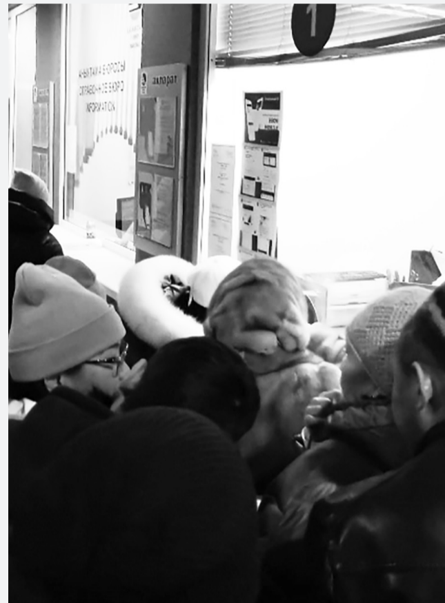
Пассажиры, стоящие в очереди у кассы №1 на вокзале г. Уральска после тщательных шести часов ожидания.

Отдельная тема – наши железнодорожные вокзалы, состояние которых оставляет желать лучшего. Я просто окончил, сидя на железнодорожном вокзале Актобе. Немного поднял шум, на который пришел начальник вокзала. Он, конечно, посоветовал, что мой поезд опаздывает, но тоже ничего не мог с этим поделать. Насчет холода на вокзале только пообещал принять меры. Ну, хоть что-то... подумалось мне, не совсем безразличный человек оказался.